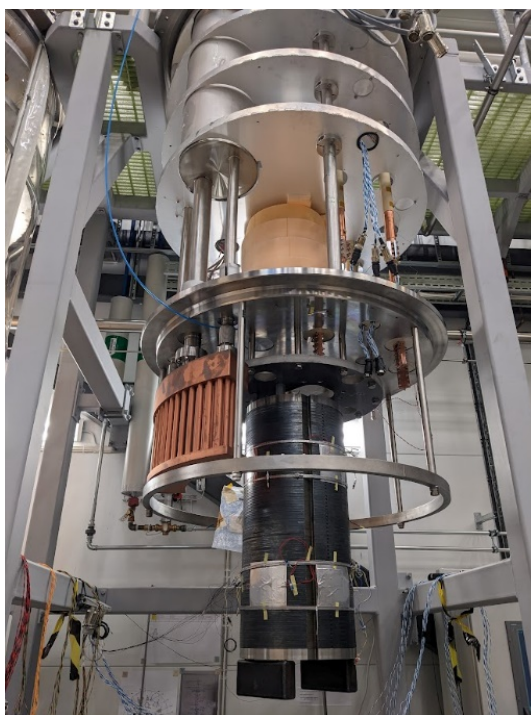
A SuShi szeptum mágnes az Uppsalai Egyetem "Gersemi" kriosztátjának belső struktúrájára szerelve.